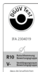
SOLITEX ADHERO VISTO