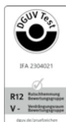
SOLITEX ADHERO 3000