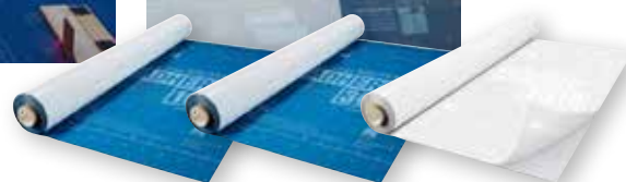
SOLITEX ADHERO 1000/3000/VISTO