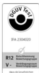
SOLITEX ADHERO 1000